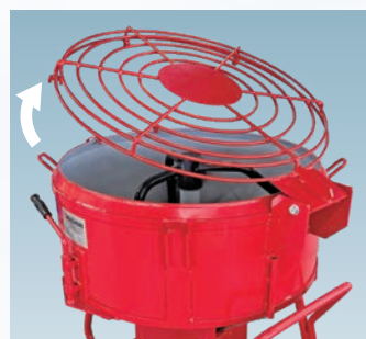
■高速モルタルミキサーSTHシリーズ 仕様表