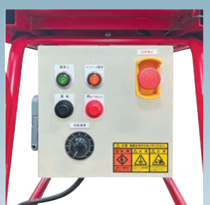
安心・安全の制御盤