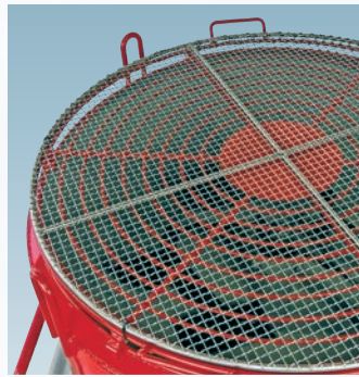
■カバーリンクインバータミキサーSTH-Aシリーズ 仕様表