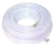
9φ・12φスラリーホース