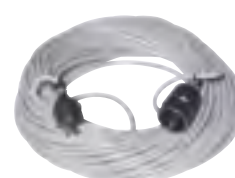
リモコン中継コード