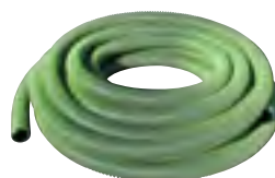
50φ・65φバンナーTMホース