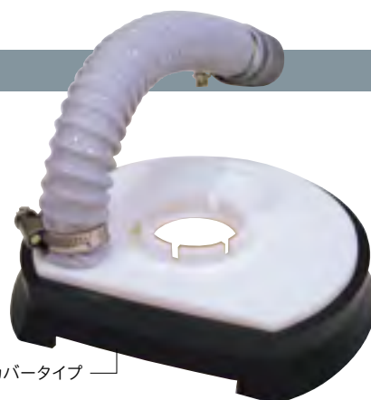
ゴムカバータイプ

※クリーンワークは集塵を目的とするもので、安全カバーではありません。 取り扱いにはご注意ください。