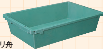
ポリ舟 大(2.5×4尺) 中(2×3尺) 小(1.5×2尺)